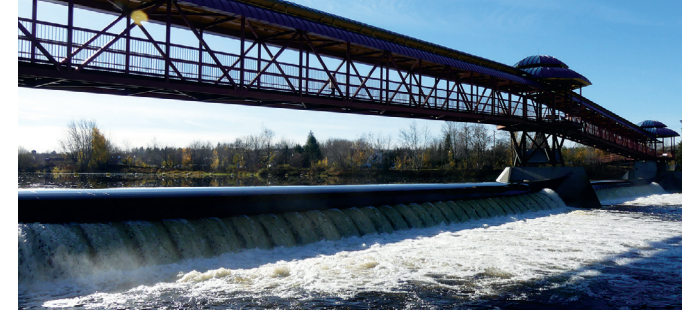
L'aménagement d'un barrage gonflable sur la rivière Chaudière permet la pratique de sports nautiques sur un plan d'eau navigable de plus de deux kilomètres.

Le maire de la Ville de Saint-Georges, M. Claude Morin, reconnaît que plusieurs investissements ont été faits depuis les 12 dernières années, ce qui a permis de donner une toute nouvelle allure à la ville. Un véritable vent de fraîcheur a soufflé sur la municipalité, ce qui lui a permis de devenir un véritable attrait aux yeux de plusieurs, peu importe la saison.