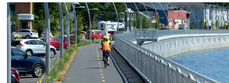
Grâce au mur de soutènement érigé aux abords de la rivière Chaudière, une piste cyclable est accessible en plein cœur du centre-ville.