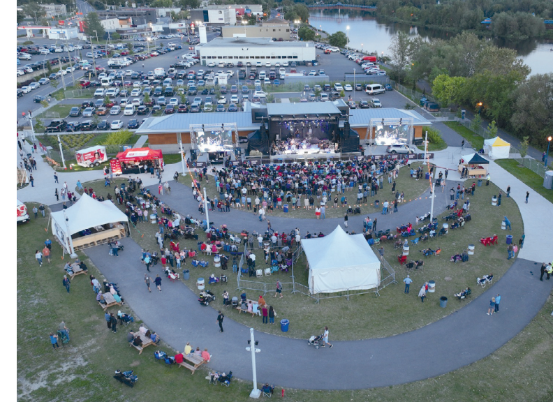
Située sur l'île Pozer, l'espace Carpe Diem accueille des artistes qui viennent performer sur sa scène extérieure toutes les fins de semaine de l'été.